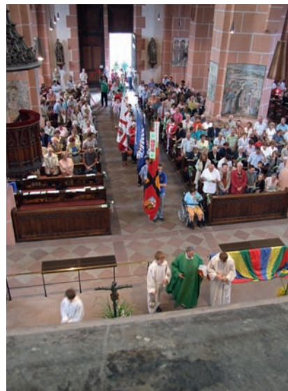
Bereits beim Familienfestival 2007 in Oberwesel fand ein sehr interessanter Gottesdienst in der Liebfrauenkirche statt.

und interessantes Programm für die Delegierten des Bundesjugendtages. Ein ganz besonderes Highlight wird der Gottesdienst am Samstagabend sein, der in der Liebfrauenkirche in Oberwesel stattfindet.