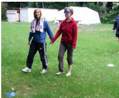
Vertrauen durch Partnerführung.

Zum zweiten Mal führten die Bistümer im Südwesten (Mainz, Limburg, Speyer, Trier, Freiburg) für DJK-Übungsleiter/innen eine Zusatzqualifikation im Bereich der allgemeinen Gesundheitsvorsorge durch. Dabei trafen sich im Sport- und Freizeitzentrum des Sportbundes Rheinhessen in Seibersbach 17 interessierte DJKler/innen, um sich in einer 60 stündigen Ausbildung über die aktuellen Erfordernisse des Sports in der Prävention zu schulen.