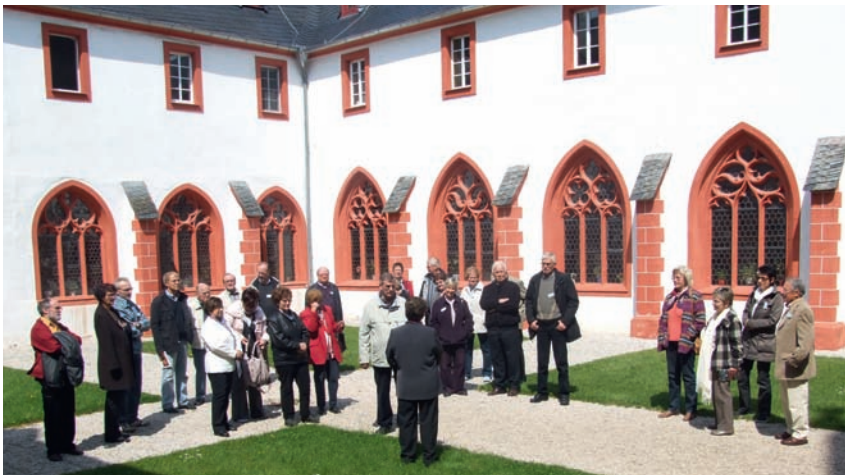
Die Teilnehmer/innen im Innenhof des Cusanusstifts.