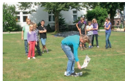
Spiele standen im Mittelpunkt und begeisterten.

Besonders bedanken möchten wir uns noch für die zahlreichen Geld-, Salat- und Kuchenspenden und freuen uns schon auf eine weitere tolle Aktion im nächsten Jahr!