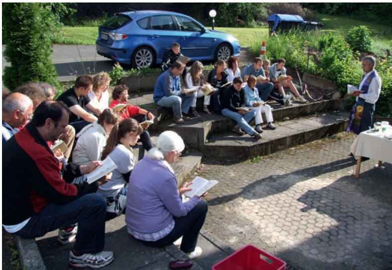
Gottesdienst als Höhepunkt der Ausbildung.