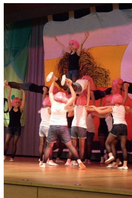
Die Tanzmäuse der DJK Ochtendung hielten die Delegierten mit ihrer Tanzeinlage bei Laune.