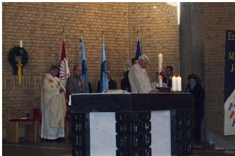
Ein Gottesdienst bildete den Auftakt des Diözesantages.

konnte der DJK-Präsident zu einem Impulsreferat zum Thema „Kirche und Sport vor Ort“ gewonnen werden. In seinen Ausführungen skizzierte er die Rahmenbedingungen für ein gelingendes Miteinander von Kirche und Sport. Dabei zeigte er Problemfelder auf, aber auch Chancen und Möglichkeiten, die sich an der Basis eröffnen. „Kirche und Sport“ können sich viel geben und gemeinsam den Menschen zu einem guten und glücklichen Leben verhelfen, wenn sie aufeinander zu gehen und sich stützen.