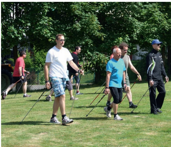
Ausdauer durch Nordic Walking.

Es war eine spannende Woche, die vielfältige Themen bereithielt. Gemeinsam wurden Sportarten ausprobiert und kennengelernt, die sich besonders gut als Vereinsangebote eignen. Im Kurssystem sollen attraktive Bewegungsangebote helfen, dass sich Menschen für das Sporttreiben in den DJK-Vereinen entscheiden. Das Qualitätssiegel „Pro Gesundheit“ garantiert hierbei eine hohe Qualität der Angebote.