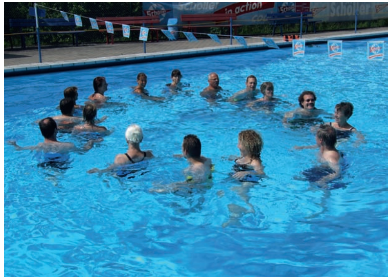
Aqua Jogging für die Fitness.

Der sehr gelungene Lehrgang wurde durch einen gemeinsamen Gottesdienst mit dem geistlichen Beirat des Diözesanverbandes Limburg Klaus Waldeck und einer geselligen Lizenzfeier abgeschlossen.