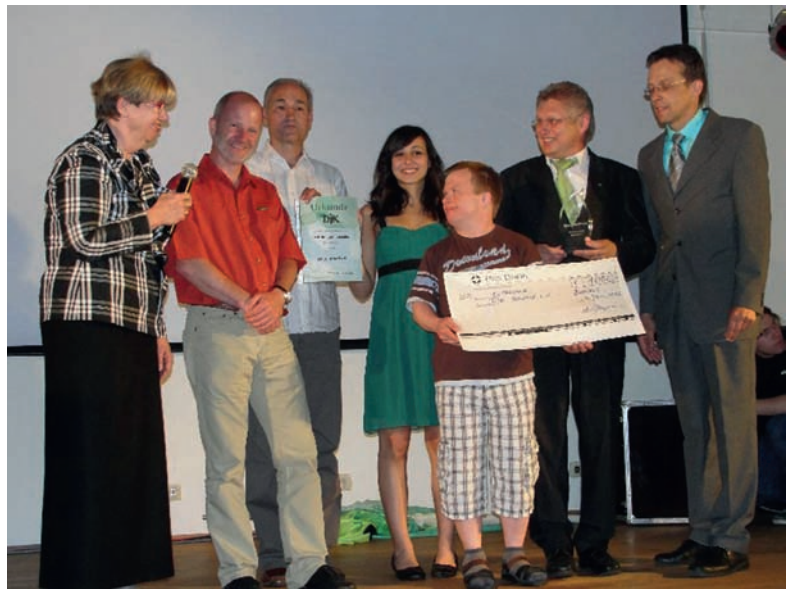
Der Präsident des DJK-Sportverbandes (rechts) überreicht die Auszeichnung.

Für die DJK Betzdorf ist dieses Engagement seit Jahren eine Selbstverständlichkeit. So besteht seit mehr als 12 Jahren die Behindertensportgruppe „Blue Camels“, die im Gesamtverein integriert ist und bei allen Aktivitäten mitmacht. Auch die gelebte Integration von Migranten aus 15 Nationen ist in Betzdorf vorbildlich und nachhaltig. Der DJK Betzdorf wurde der Integrationstaler im Rahmen des DJK-Bundestages vom 4.-6. Juni 2010 in Dortmund verliehen.