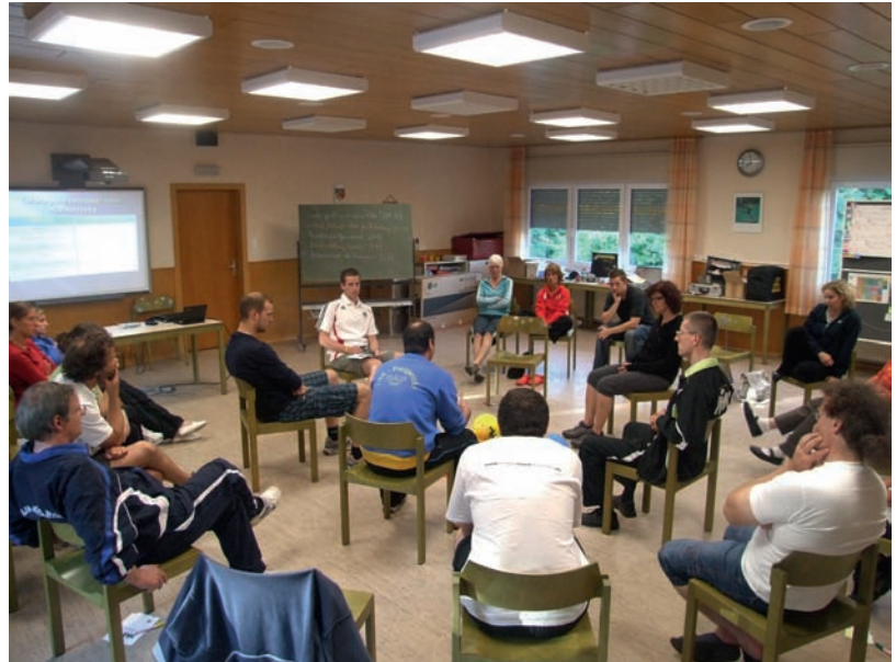
Einstieg ins Thema. Diskussion zum Thema Gesundheitssport.