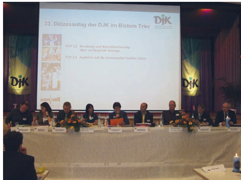
Der neu gewählte Vorstand in der Kulturhalle in Ochtendung.