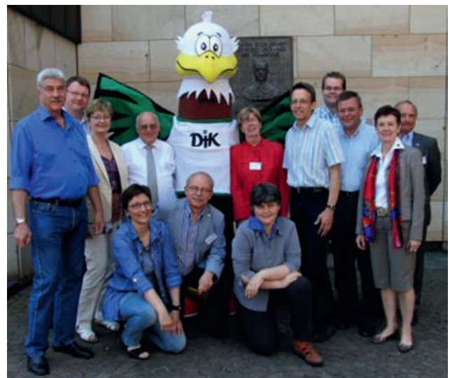
DJK-Präsidium mit Carli, dem neuen Maskottchen des DJK-Sportverbandes.

Ein Festgottesdienst mit Weihbischof Hubert Berenbrinker (Erzbischof Paderborn) beendete den 30. DJK-Bundestag. Nächste Großveranstaltung des DJK-Sportverbandes werden die DJK-Winterspiele im DJK-Diözesanverband Passau vom 11. bis 13. Februar 2011 sein.