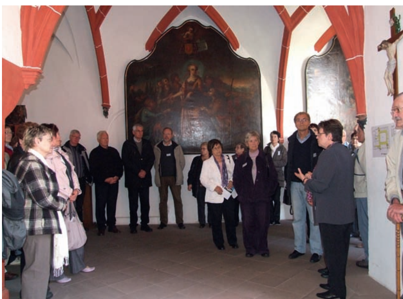
... im Kreuzgang des Stifts.

Nach einer gemütlichen Abschlussrunde in freudiger Stimmung verabschiedeten sich die Teilnehmer/innen, gestärkt mit viel Wissen über eine bedeutende Figur des Bistums Trier, nach Koblenz, Ochtendung, Mayen, Hülzweiler, Marpingen, Trier und Brey.