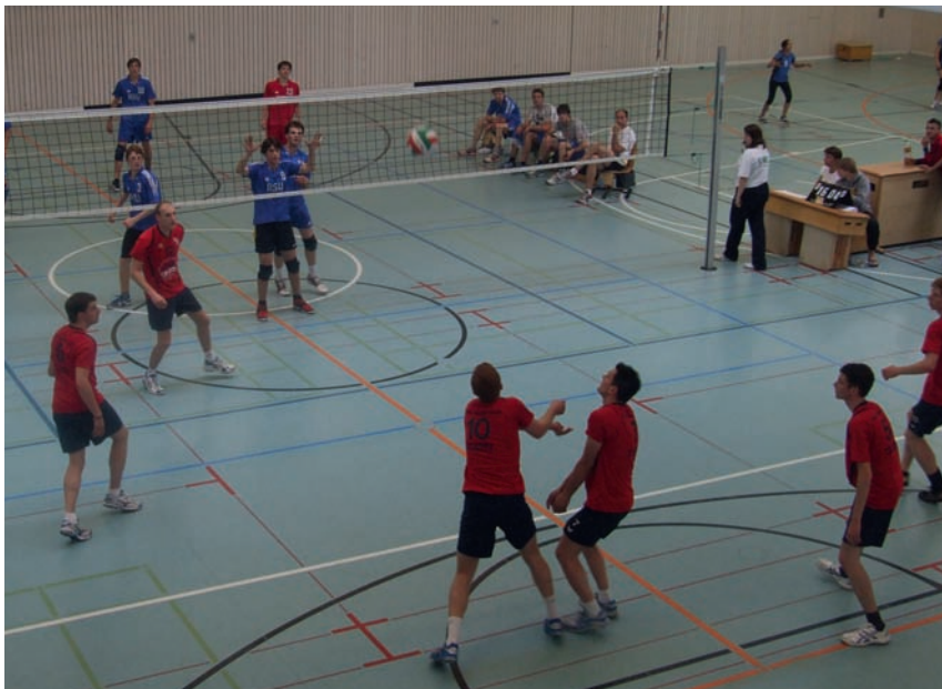
Beim Volleyball glänzten u.a. die Frauen der DJK Andernach.

Rund 5.000 Sportlerinnen und Sportler erlebten über Pfingsten in Krefeld beim 16. DJK-Bundessportfest vier spannende und emotionsgeladene Tage. Bei strahlendem Sonnenschein kämpften die Teilnehmer auf dem Sprödentalplatz, dem Festgelände des Bundessportfestes, und an den über 20 Sportstätten in und um Krefeld um den Meistertitel und die Platzierungen.