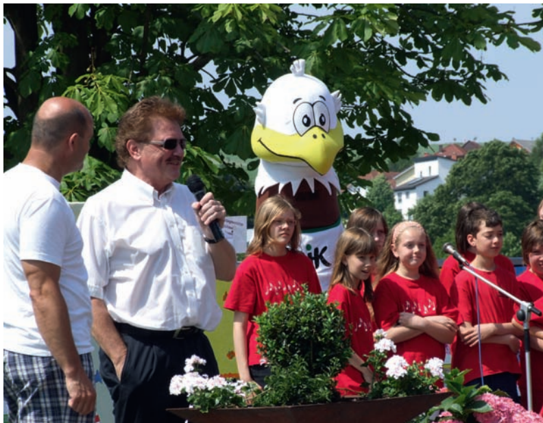
Auch Carli war bei der Eröffnung des Festes durch den Schirmherrn Minister Karl Rauber (2.v.l.) dabei.

„Kinder stark machen“-Spielfest begeisterte fast 1.000 Besucher!