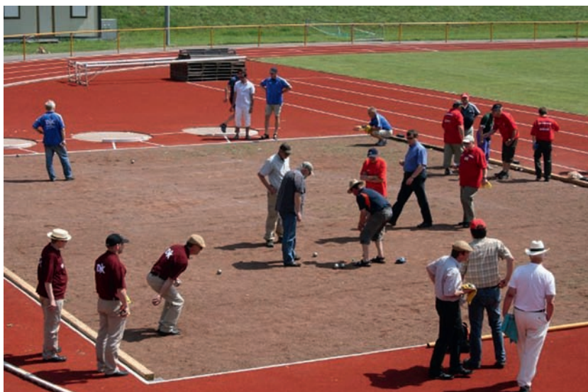
Eine tolle Atmosphäre und prima Wetter begleitet im letzten Jahr die erstmals durchgeführte Meisterschaft in Oberwesel.