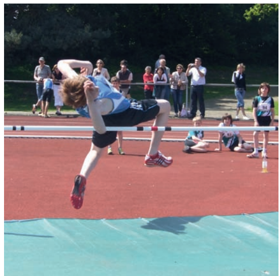
Auch der starke Nachwuchs der TuS DJK Herdorf gab beim 16. DJK-Bundessportfest sein Bestes.