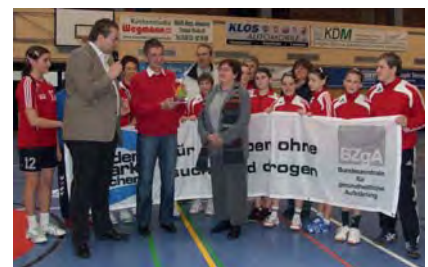
Erster Platz. Strahlende Gesichter bei der Preisverleihung.