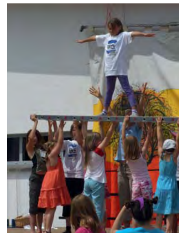
Starke Kinder. Gemeinsam agieren und Aufgaben meistern.