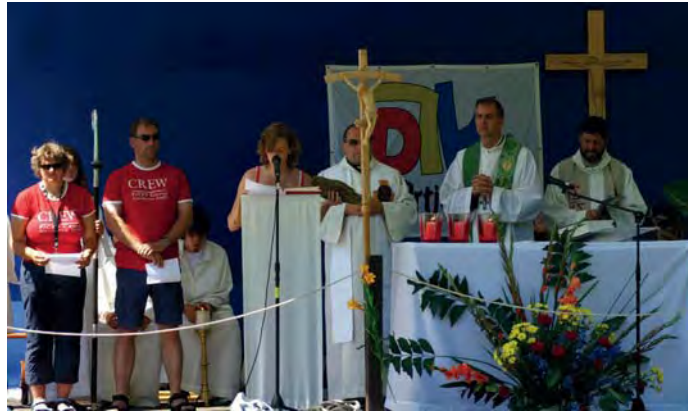
Ficep-Camp. Herdorf war für zehn Tage der Mittelpunkt der europäischen Sportbewegung FICEP.