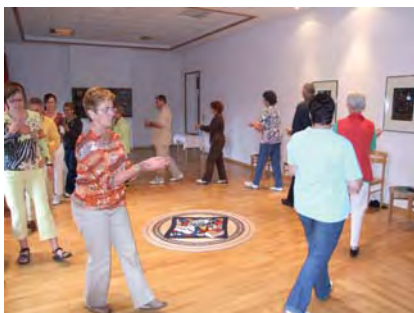
Sportexerzitionen. Meditativer Tanz ein Element der Besinnung und Begegnung.

Aus dem kirchlichen Bereich kennt man Exerzitien. Es sind Übungen des geistlichen Lebens nach dem Modell des hl. Ignatius von Loyola (1491-1556). Heute gibt es in Anlehnung an die klassische Form (Schweigen, betrachtendes Gebet, biblische Impulse in den christlichen Glauben) verschiedene Formen von Exerzitien: Gruppenexerzitien oder Einzlexerzitien, Exerzitien im Alltag oder Wüsten-Tage, Kloster auf Zeit oder Tage religiöser Besinnung mit Vorträgen, Gebet und seelsorgerischer Aussprache. Ziel der Exerzitien ist es, über sich und den Glauben neu nachzudenken und Kraft für das Leben zu schöpfen. Es geht darum, das eigene Leben zu gestalten und den nächsten Schritt in die Zukunft zu gehen. Es hat mit Ruhe und Besinnung zu tun, mit Neuordnung des Lebens.