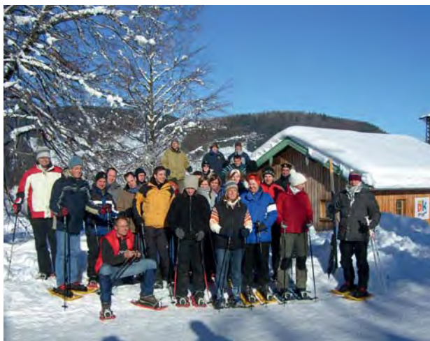
Anfang. In Ruhpolding trafen die Mitglieder der DJK-Sportjugend 2006 erstmals zusammen.

Der DV Trier schickte neben seinem Jugend- und Bildungsreferenten noch sieben weitere Delegierte und Gäste auf den Bundesjugendtag nach Ruhpolding. Dort lernten die „Neulinge“ in den DJK-Strukturen die Organisation DJK besser kennen, knüpften erste Kontakte zu anderen Diözesanverbänden und