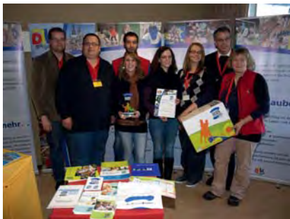
König der Löwen. Die Tanzgruppen der DJK Ochtendung imponierten.

„Kinder-stark-machen - Wie einen Löwen!“ Das war das Motto der DJK Ochtendung, die in einer Meisterleistung den ersten Platz innerhalb der Kategorie I mehr als verdient hat.