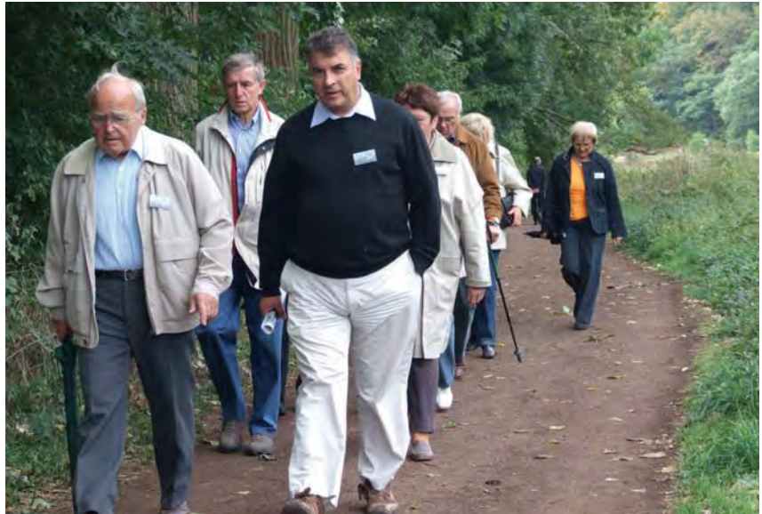
Besinnung. Nachdenklich und besinnlich ging es am Laacher See zu.

HINWEIS: Am Samstag, 8. Mai 2010 ist ein ähnlicher Besinnungs-Begegnungstag vorgesehen im St. Nikolaus-Hospital (Cusanusstift) zu Bernkastel-Kues. Nikolaus von Cues, der Universalgelehrte des Mittelalters und seine Bedeutung für unsere Zeit werden das Thema sein.