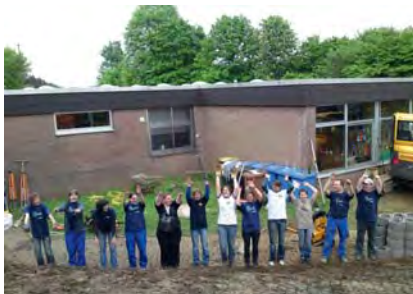
Solidarität. Eine gute Stimmung herrschte bei der 72-Stunden Aktion in Mudersbach.