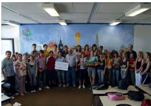
Alle zusammen. Die Schülerinnen und Schüler der Klasse 8 b der ADS-Hargesheim, ihre Lehrerinnen und Lehrer, Bruder Lösch und die DJK-Diözesanvorsitzende.

niemals Angst um mein Leben haben“. Er hat sich mit den Einheimischen und der Umwelt arrangiert, kennt ihre Rituale und Gewohnheiten, kennt aber auch die