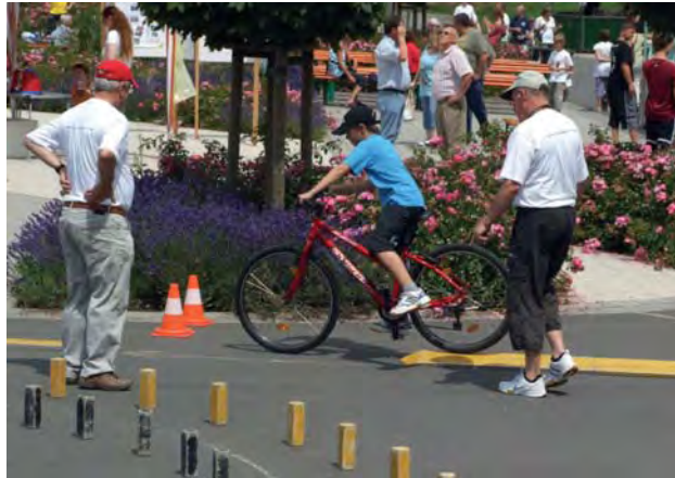
Geschicklichkeit. Im Fahrradparcours war Konzentration und Aufmerksamkeit gefragt.