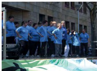
Handicap. Es gab großen Beifall für die Behindertensportgruppe der DJK Betzdorf.