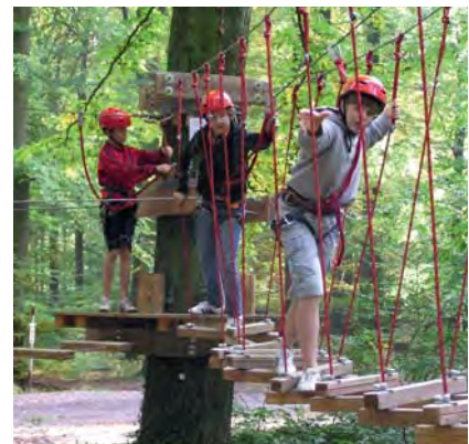
Step by Step. Viel Geschick und Konzentration waren beim Überwinden der Hindernisse gefragt.

Im Saarland, im Westerwald und der Eifel wurden besondere Erlebnisse für Kinder und Jugendliche vermittelt. Die DJK-Sportjugend hatte eingeladen und über 100 Jugendliche folgten dem Ruf nach Abenteuer und Erlebnis. Im Waldhochseilgarten Kastellaun, im Abenteuerpark Saar in Saarbrücken sowie im Hochseilgarten in Wissen konnten unterschiedlich anspruchsvolle Parcours in verschiedenen Höhen begangen werden. Vorher und im Anschluss gab es DJK-spezifische Impulse, die das Mehr der DJK bei den Teilnehmern spürbar werden ließen.