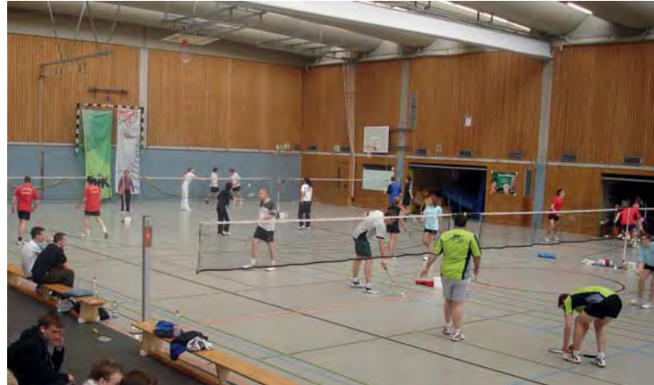
Bundesmeisterschaften. Alle 330 Spiele wurden an zwei Tagen ohne Schiedsrichtereinsatz absolviert.

Im Fortbildungsbereich wurde Badminton mit verschiedenen Themenschwerpunkten bei den DJK-Übungsleitertagen angeboten, spezielle Badmintonfortbildungen oder Diözesanmeisterschaften wurden von den Vereinen nicht angefragt. Bei