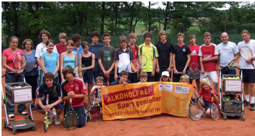
Tennis Camp. Drei gelungene Tage bei der DJK Eintracht DIST.

15 Teilnehmer aus drei saarländischen DJK-Vereinen folgten der Einladung der Sportjugend, im Saarbrücker Stadtwald das Abenteuer des Hochseils zu erleben und dabei DJK-Erfahrungen zu sammeln. Beim gemeinsamen Abschluss mit Leckereien vom Grill wurde der Tag reflektiert und eine Wiederholung im nächsten Jahr gewünscht.