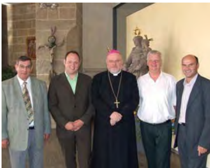
Eingeladen. Zu einem Meinungsaustausch hat Bischof Dr. Reinhard Marx eingeladen.

Zu einem Austausch über aktuelle Themen der Jugendarbeit im Bistum Trier hatte Bischof Marx die Vertreter der Jugendverbände in sein Haus geladen. In entspannter und guter Atmosphäre