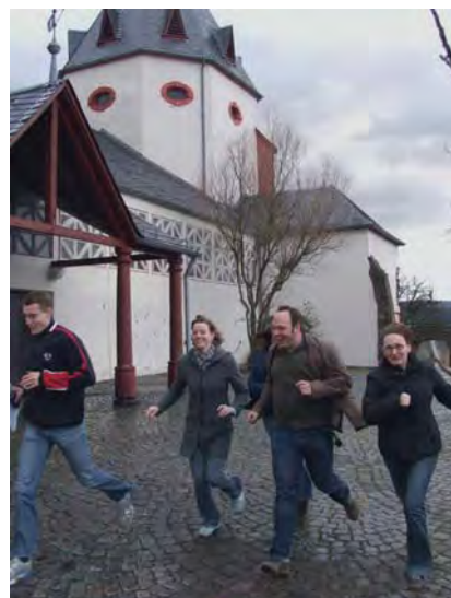
Marienburg. Mittelpunkt der DJK-Sportjugend im Bistum Trier.

Vom 22. bis 24. Juni lud die Sportjugend, die in der Jugendarbeit in den Vereinen engagierten Vertreter zu einem Kennenlernwochenende unter dem Motto „DJK-Sportjugend entdecken“ auf die Marienburg, ein Bildungszentrum des Bistums in der Nähe von Bullay, ein. 20 Verantwortliche aus sechs DJK-Vereinen folgten der Einladung und erlebten ein Wochenende vollgepackt mit Abenteuersport, DJK-spezifischem Inhalt und Informationen rund um die Sportjugend. Der Grundstein für eine jährliche Veranstaltung war gelegt.