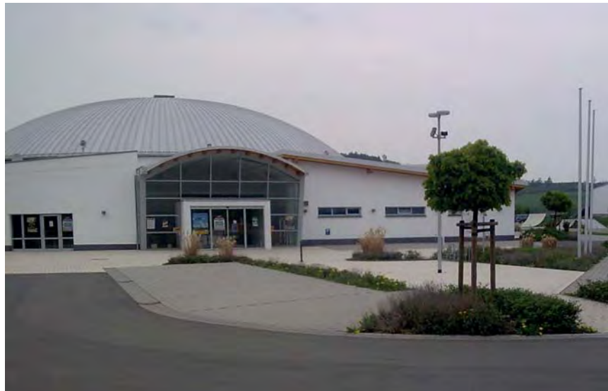
Tagungsstätte. Kulturhalle in Ochtendung.