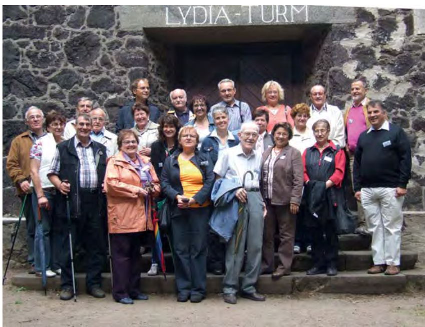
Laacher See. Die Teilnehmer/inne vor dem Lydia-Turm.