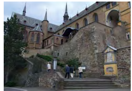
Kalvarienberg. Ein idealer Ort für Einkehr und Ruhe.