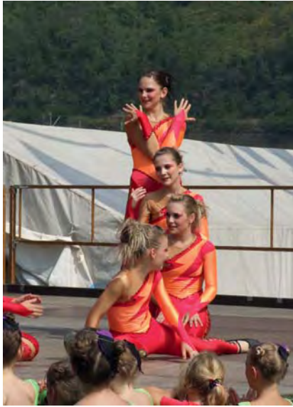
Faszination. Perfekte Tänze waren ein besonderes Highlight.

tionsfähigkeit zu fördern, damit sie NEIN zu Suchtmitteln sagen können. Hierzu ist das Familienfestival mit seinen vielen attraktiven Angeboten zur Förderung der Persönlichkeit sicherlich der richtige Ort gewesen.