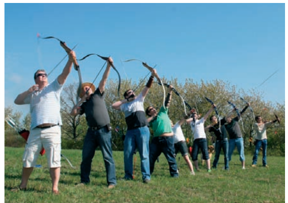
„Auf Wolken schießen“

Bei schönstem Wetter und mit Kaffee und Kuchen zur Stärkung versorgt, war die Stimmung entspannt und ausgelassen. Für die Helfer gab es am nächsten Tag noch ein besonderes Dankeschön. Die Schützen fuhren nach Winzberg zum Cloudschießen, eine Bogendisziplin, bei der man im hohen Bogen möglichst nah an das Ziel in 150 Meter Entfernung herankommen soll.