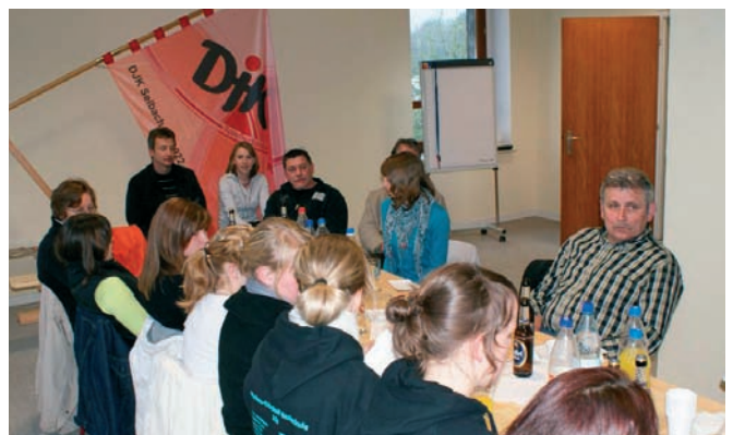
In den neuen, vereinseigenen Räumen der DJK Selbach fand eine sehr interessante Jahreshauptversammlung statt.

Desweiteren wird es am 04.09.2010 in der Stadt Wissen einen „Freiwilligentag“ geben, an welchem die DJK Selbach Tanzen, Kinderturnen, Kung-Fu und Rhönradtturnen vorführen wird. Am 15.09.2010 ist in Selbach ein Seniorentanznachmittag geplant, an welchem die Tanzgruppe der DJK Selbach ihr Können zeigen wird.