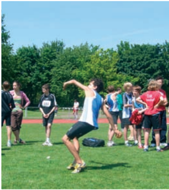
Auch der starke Nachwuchs von der DJK Herdorf gab beim 16. DJK-Bundessportfest sein Bestes.

hervorragende Wetter genießen. Am Abend trafen sich ein Großteil der Teilnehmer auf dem Festgelände um sich über die Ereignisse des Tages auszutauschen und den Tag mit Live-Musik gemütlich ausklingen zu lassen.