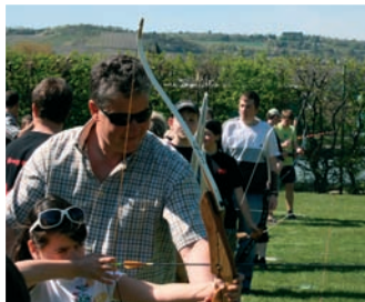
Pfeil und Bogen sorgten für Begeisterung.

Die Einweisung erfolgte durch die aktiven Bogensportler, danach konnte man auf bis zu 20 Meter die Ringe anvisieren und das eigene Können testen. Für die etwas Kleineren wurden Luftballons, Dosen und 3D-Tiere aufgestellt, welche es zu treffen galt.