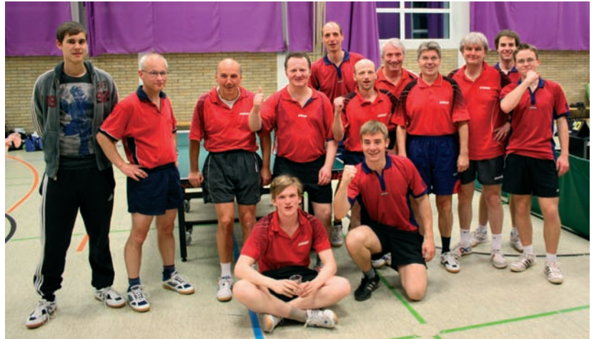
Die 1. und 2. Herrenmannschaft nach ihrem gemeinsamen Triumph am letzten Spieltag.