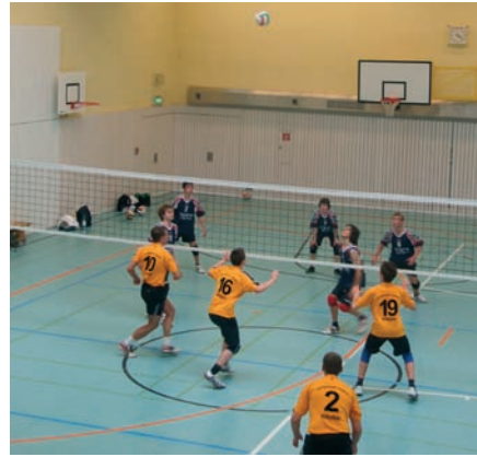
Die Volleyballmannschaft der DJK Saarbrücken-Rastpfuhl zeigten vollen Einsatz und wurden mit einem Platz am dem Siegerpodest belohnt.

Am Abend des letzten Austragungstages wertete Volker Monnerjahn, der Präsident des DJK-Sportverbandes das DJK-Bundessportfest als vollen Erfolg und bedankte sich bei den ganzen Helfern und Organisatoren ohne deren tatkräftige Unterstützung eine solche Großveranstaltung nicht möglich gewesen wäre. Er