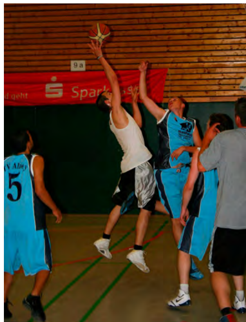
DJK Basketballnight - Spannende Spiele voller Leidenschaft und Fairness