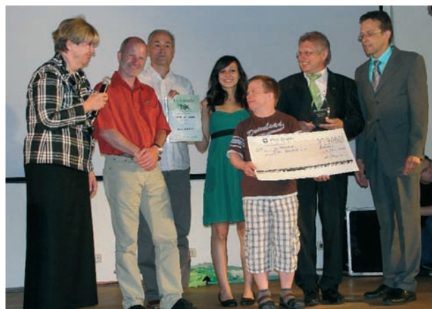
Der Präsident des DJK-Sportverbandes überreicht die Auszeichnung.

Die Jury des Präsidiums des DJK-Sportverbandes hat entschieden: Der Integrationstaler 2010 geht an die DJK Betzdorf aus dem DJK-Diözesanverband Trier. Der mit 1.000 € dotierte Preis unterstützt Initiativen der bundesweit gut 1.200 DJK-Sportvereine, die sich besonders um Randgruppen der Gesellschaft sowie Menschen mit Handicap kümmern. Für die DJK Betzdorf ist dieses Engagement seit Jahren eine Selbstverständlichkeit. So besteht seit mehr als 12 Jahren die Behindertensportgruppe „Blue Camels“, die im Gesamtverein integriert ist und bei allen Aktivitäten mitmacht. Auch die gelebte Integration von Migranten aus 15 Nationen ist in Betzdorf vorbildlich und nachhaltig. Der DJK-Betzdorf wurde der Integrationstaler im Rahmen des DJK-Bundestages in Dortmund verliehen.