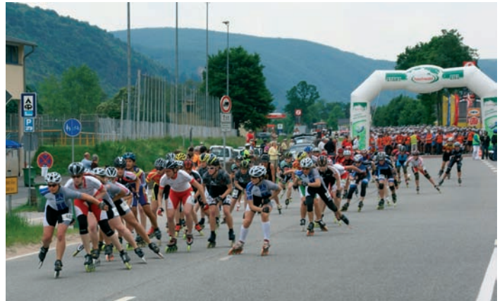
Die über 1600 Skater gaben vom Start an Vollgas.

Doch nicht nur Helfer, sondern auch aktive Sportler der DJK Oberwesel waren am diesjährigen Mittelrhein-Marathon beteiligt.