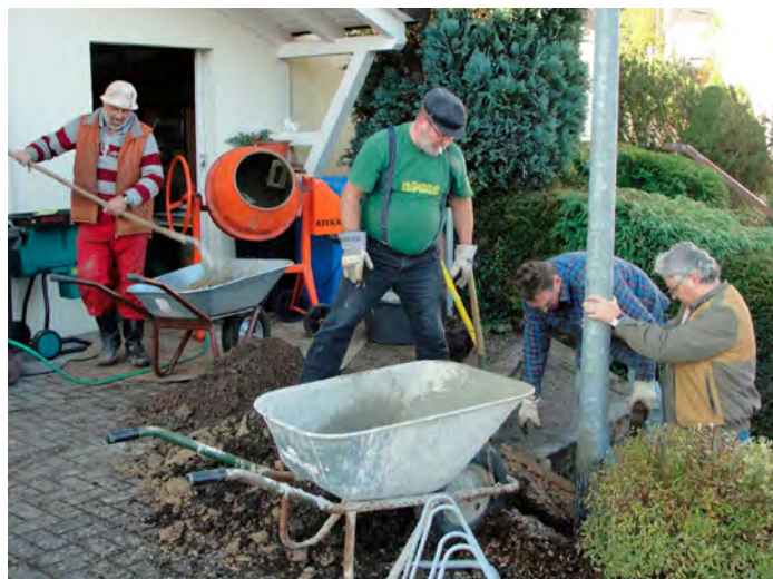
Nur mit vereinten Kräften war das Projekt zu stemmen.

stand aufgrund der früh einsetzenden Dunkelheit mit nur einem beleuchteten Platz viel zu wenig Spielmöglichkeit zur Verfügung. Dieser Engpass gehört Dank der Unterstützung von RWE und dem Einsatz von Herrn Sack der Vergangenheit an.