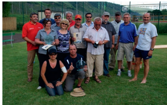
Glückliche Gewinner am Ende einer gelungen Meisterschaft.

Um eine schriftliche Anmeldung der Teams bis zum 10. August 2010 wird gebeten. Das Team kann frei zusammengestellt werden, allerdings muss eine Spielerin oder ein Spieler einem DJK-Verein angehören.