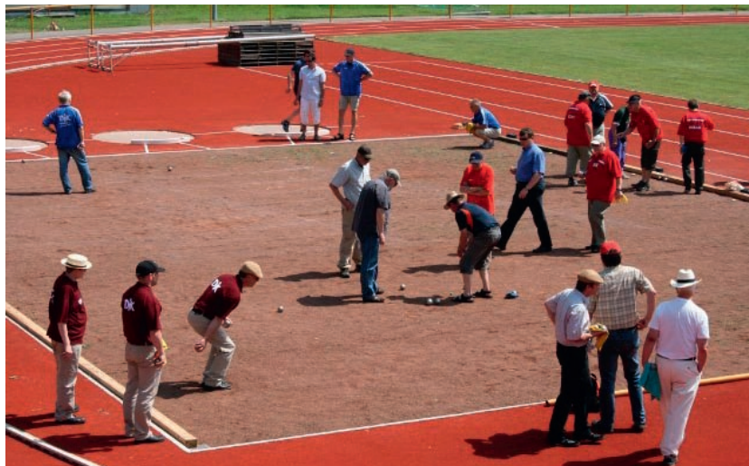
Eine tolle Atmosphäre und prima Wetter begleitete im letzten Jahr die erstmals durchgeführten Meisterschaften in Oberwesel.